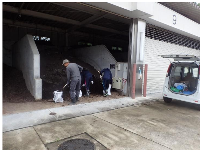
※詰め込み作業の様子 (スタッフの作業補助はありません)