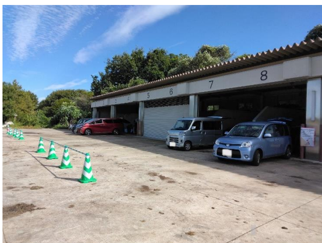
※コンポストセンター内の様子 (1つのスペースに2台ずつ案内します)