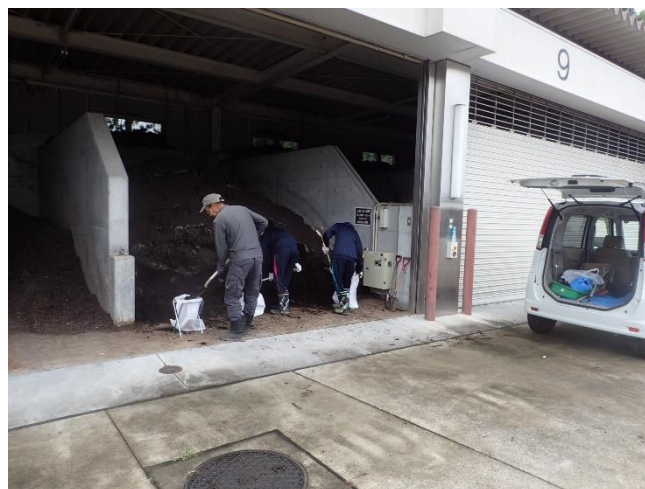
※詰め込み作業の様子 (スタッフの作業補助はありません)