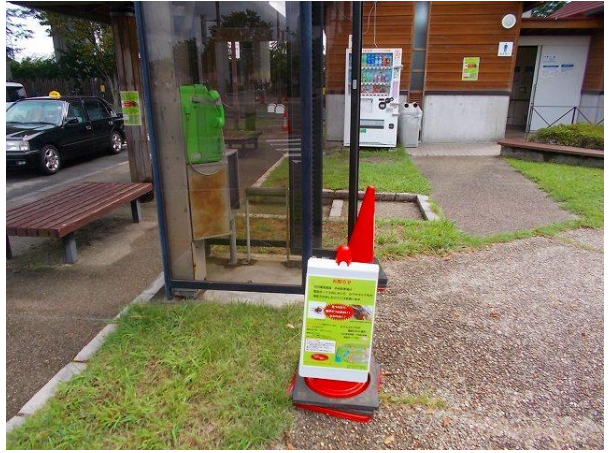
④ 注意喚起看板(近景)