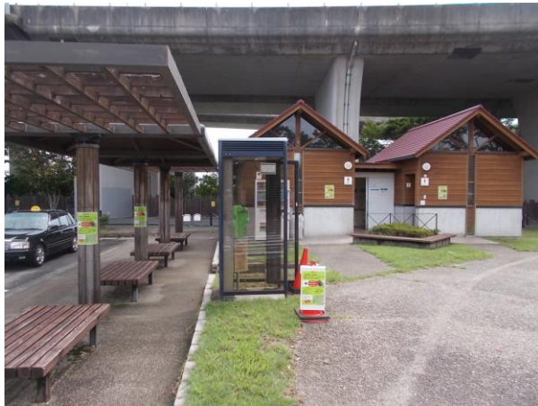
③ 注意喚起看板(遠景)