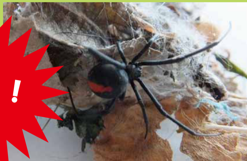
巣の張り方は不規則で立体的です。