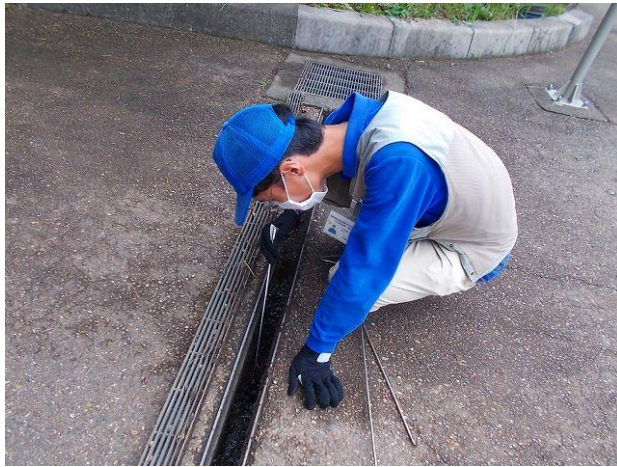
⑤ 緊急点検 第2ゲート前側溝