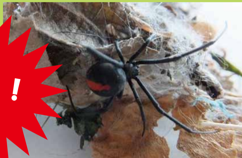
巣の張り方は不規則で立体的です。