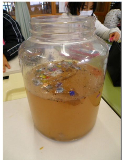
川を汚したのは誰でしょうか

ボトルの水を川に見立てます。源流からスタートして河口に向かう途中で色々な出来事が起こります。