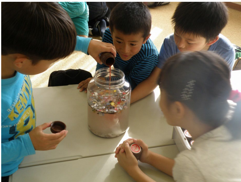
6～10名のグループワークで進めます

パークセンターでもっとも人気の高いプログラム「川を汚したのは誰だ」などを体験し、ご希望の方には園内の施設をご案内します。環境教育講座に関心のある学校やこども会等の団体に所属する方におすすめです。小学生のお子様の参加も可能です。 1名様から参加できますので、遠足の下見などにご利用ください。