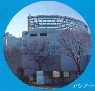
アクア・トトぎふ