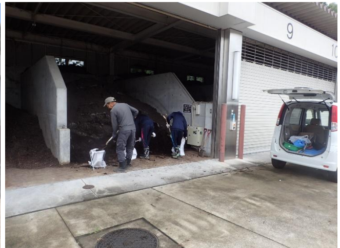
※詰め込み作業の様子 (スタッフの作業補助はありません)