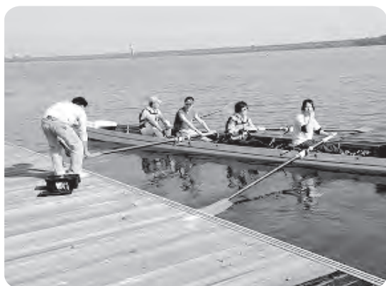
写真は前回の様子です