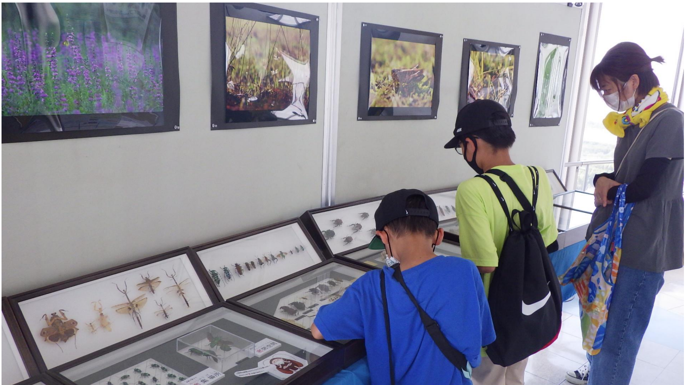
昨年の展示の様子

ツインアーチ138展望階では夏休みに合わせて「地球のなかまたち展」を開催します。身近な昆虫から世界の昆虫、海にまつわるものから恐竜の化石まで様々なものを展示します。地球には今どんななかまたちが生きているのか。昔はどんななかまたちが生きていたのか。いま生きているなかまたちを守るにはどうすればいいのか。展示を見ながら考え、想像してみよう！！ご多忙とは存じますが、是非ご取材並びにご掲載のほどよろしくお願ひします。