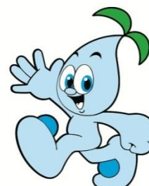
公園マスコットキャラクター ミズリン

〒491-0135 愛知県一宮市光明寺字浦崎 21 番地 3 138 タワーパーク企画広報 鈴木・山田・重本 電話 0586-51-7105 FAX 0586-51-7107 ホームページ https://kisosansenkoen.jp/