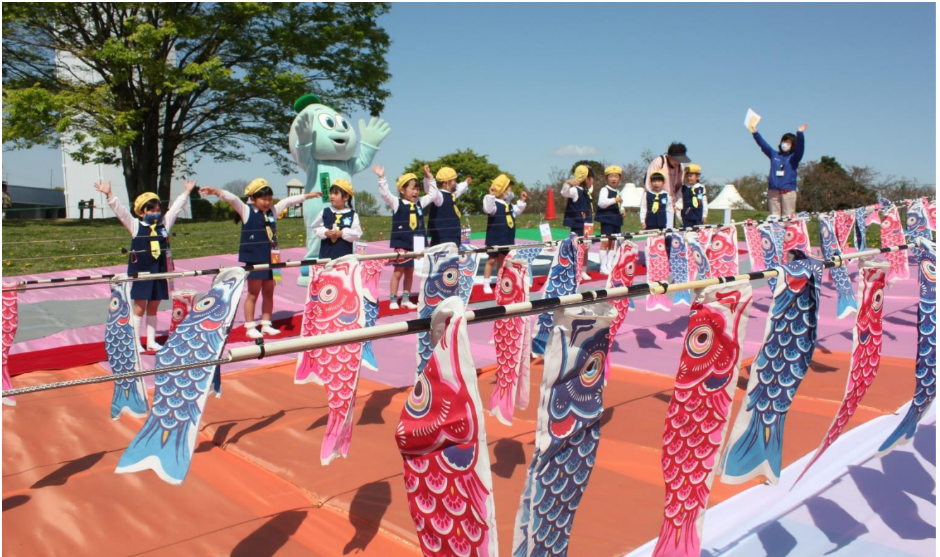
令和3年4月のセレモニーの様子