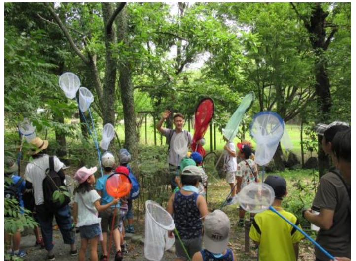
公園内で楽しく昆虫を探す様子