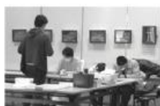
ウッドクラフト教室

期間中[11/23(土)~12/25(水)]の土日祝に体験教室を開催します。芸術や工作などの様々な体験をお楽しみください。日程や料金等の詳細は公式サイトまたはお電話にてご確認ください。