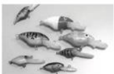
3Dプリンターで作る 釣り道具教室