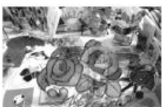
プリザーブドフラワー & グラスアート教室