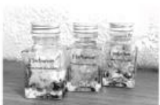
宝石石鹸と ハーバリウム教室