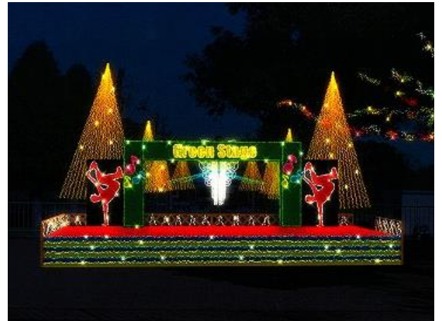
ダンスミュージック