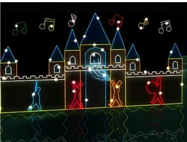
おもちゃのマーチ