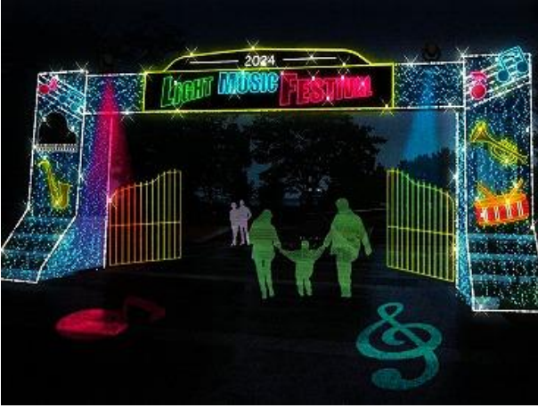
LIGHT MUSIC FESTIVAL