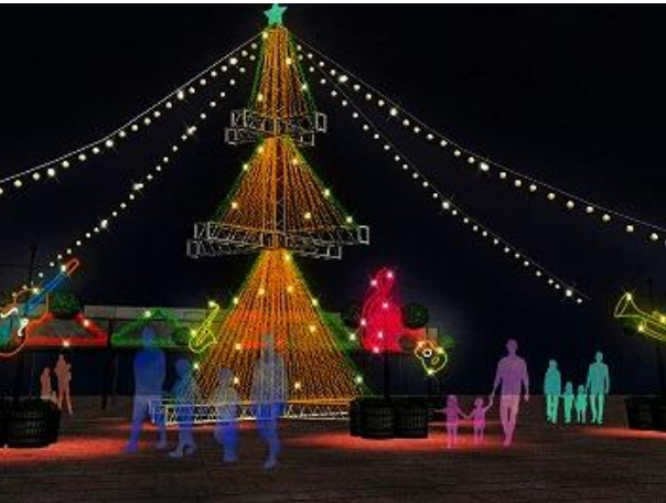
クリスマスマーケットともみの木