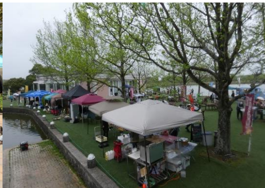
■海津アクアマルシェ (昨年春の様子)