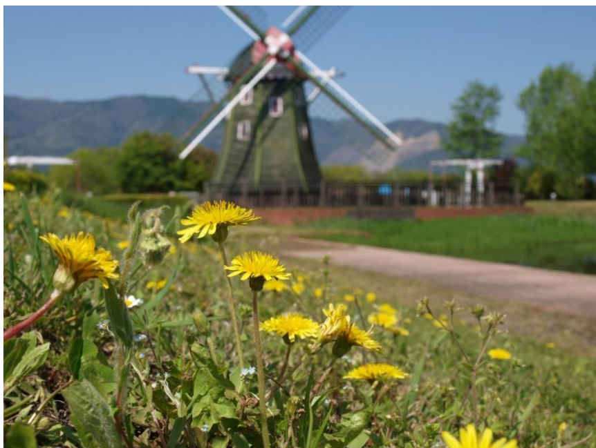
■写真：日本タンポポと風車（4月撮影）

アクアワールド水郷パークセンターで令和7年4月5日（土）～30日（水）の期間中に「パークセンターたんぽぽまつり」を開催します。期間中4月19日（土）～20日（日）に開催の「ハンドメイド市」のテーマは「手作り作品大集合！」です。出店は32団体で市民参加のイベントです。また、パークパートナーによるアート&クラフトの体験教室やスラックライン体験、田舟体験などのイベントをお楽しみいただけます。同日には同時開催で「海津アクアマルシェ×ミニわんこマルシェ」を開催し地域を盛り上げます。