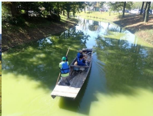
■田舟体験 (昨年秋の様子)

◎4/19・20には、ハンドメイド市と海津アクアマルシェ×ミニわんこマルシェを開催します!!