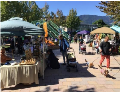
■市民ハンドメイド市 (昨年秋の様子)

◎4/19・20には、ハンドメイド市と海津アクアマルシェ×ミニわんこマルシェを開催します!!