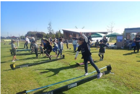
■スラックライン体験 (昨年秋の様子)